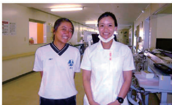
沢山の事を体験しました。