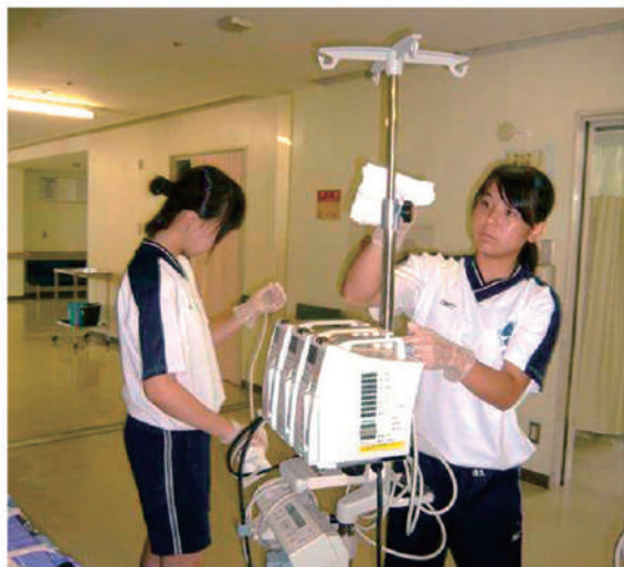
使用後の整理整頓は、次への準備。

私は今、学校の授業がとても長く感じますが、今日は時間があっという間ですごく忙しくてバタバタでした。体力も学力も精神力も必要な仕事を毎日こなす看護師さんが、とてもカッコよく見えました。