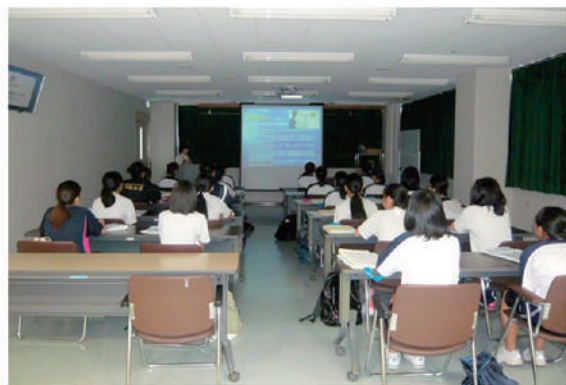
ふれあい看護体験の説明