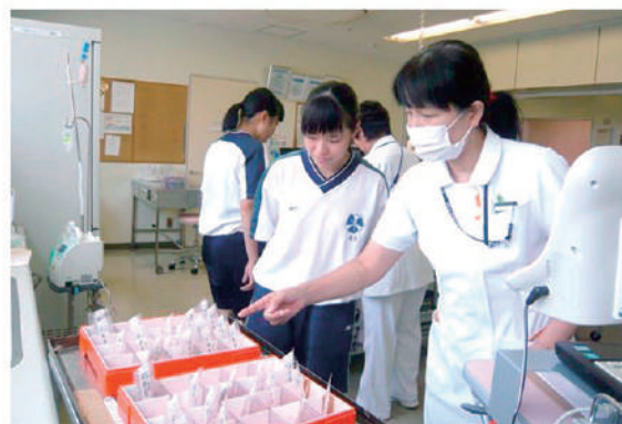
薬の確認は慎重に！