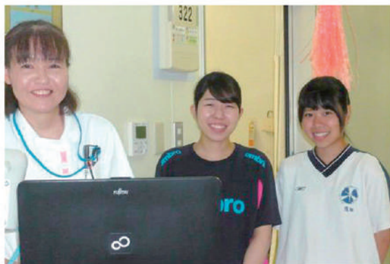
担当看護師さんと一緒に・・・