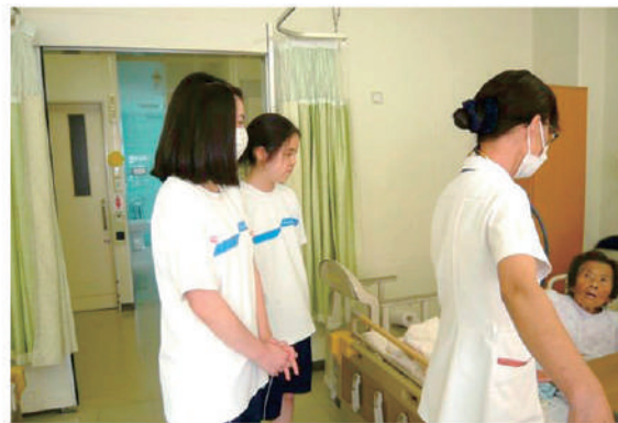
患者様とコミュニケーション